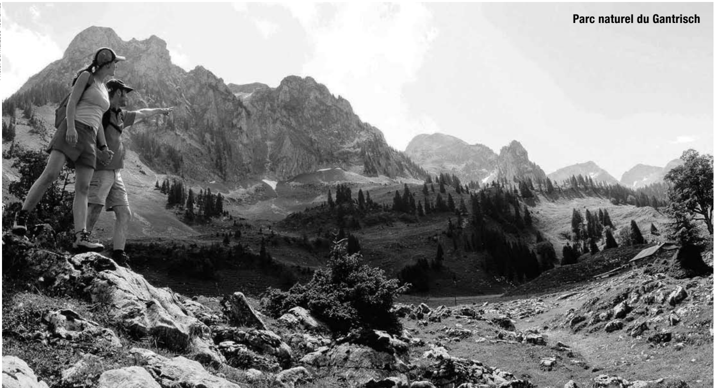
Parc naturel du Gantersch