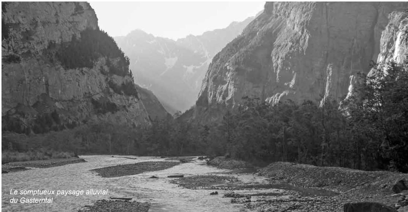
Le somptueux paysage alluvial du Gasterntal

WWF Suisse | Hohlstrasse 110 | 8010 Zurich | Annexe de la section de Berne pour le WWF Suisse | Traduction: Emmanuelle Schraut